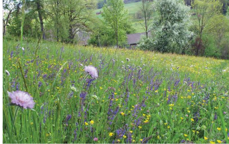
Artenreiche Wiesen bieten viel Pollen und Nektar und fördern damit die Vielfalt an Wildbienen.