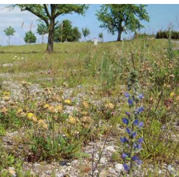
Ruderalflächen bieten Nistmöglichkeiten für bodenbewohnende Wildbienen wie die Hosenbiene.