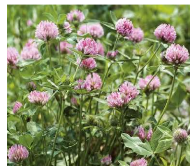
Kleearten in blühenden Kunstwiesen werden vor allem von langrüssligen Hummeln und Honigbienen besucht.