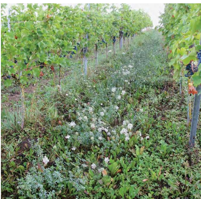
Auch in Rebbergen sind Einsaaten mit standorttypischen Blütenpflanzen möglich.

Sinnvoller und nachhaltiger als der Einsatz gezüchteter Bestäuber ist die Förderung wildlebender Wildbienen durch Erhöhen des Angebotes an Blüten und Kleinstrukturen; denn damit werden auch viele andere nützliche Insektenarten gefördert.