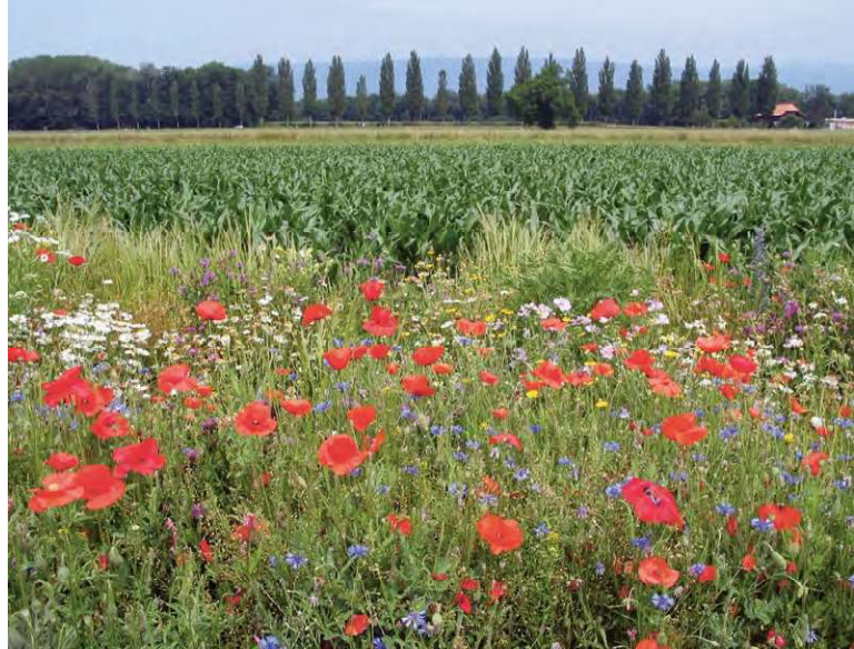
Wildbienenförderung und landwirtschaftliche Produktion lassen sich im Allgemeinen gut kombinieren. Wildbienenfreundliche Lebensräume sind nicht nur schön für das Auge, sie sind auch für die Landwirtschaft von Nutzen.

Der verbreitete Blütenmangel zwischen Juni und Ende August verunmöglicht es staatenbildenden Wildbienenarten wie den Hummeln, erfolgreich Kolonien aufzubauen. Auch solitär lebende Arten, welche nur während der Sommermonate aktiv sind, können nicht überleben. Für eine grosse Wildbienen Vielfalt braucht es ein kontinuierliches Blütenangebot von März bis Oktober.