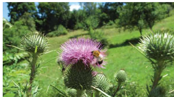
Auch extensiv genutzte Weiden mit Kleinstrukturen und offenen Bodenstellen sind für Wildbienen wertvoll.