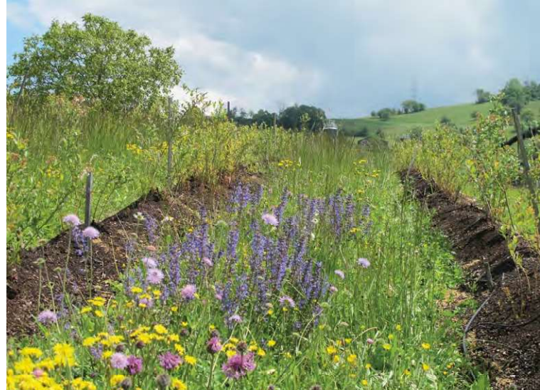
Idealerweise werden die lokal vorhandenen Bestäuber mit Nist- und Nahrungsressourcen gefördert statt in Massen gezüchtete Bestäuber freizusetzen.

www.wildbienen.info : Website eines führenden Wildbienenkenners in Deutschland