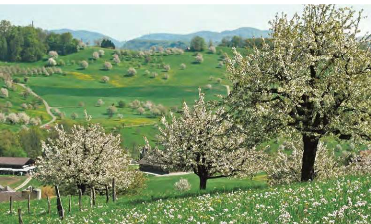
Arten- und strukturreiche Lebensräume tragen am besten zur Erhaltung und Förderung einer vielfältigen Wildbienenfauna bei.

Je vielfältiger und grösser das Blütenangebot in einer Landschaft von März bis Oktober ist, und je mehr geeignete Nistplätze in Form von lückigen Bodenstellen, Totholz, mehrjährigen Stängelstrukturen oder Trockenmauern vorhanden sind, desto mehr Wildbienenarten können sich vermehren. Je kürzer die Entfernung zwischen dem Nest und den Nahrungspflanzen ist, desto mehr Brutzellen kann eine Wildbiene versorgen. Die Nahrungsräume sollten nicht weiter als 100–300 m von den Nistplätzen entfernt sein.