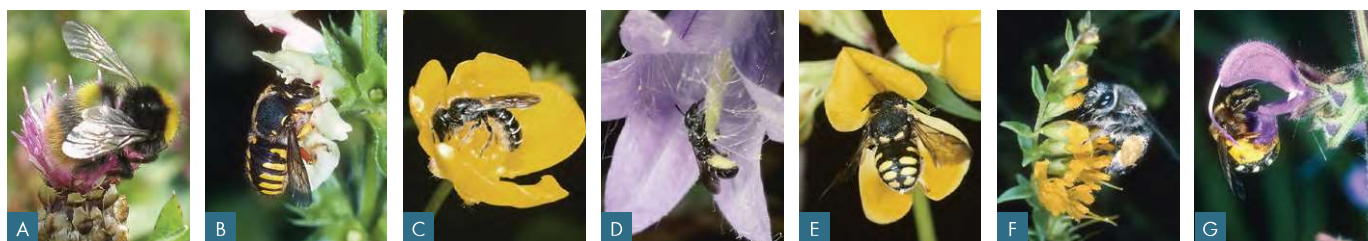
A: Wiesenhummel an Flockenblume; B: Grosse Wollbiene an Aufrechtem Ziest; C: Hahnenfuss-Scherenbiene auf Hahnenfuss; D: Glockenblumen-Scherenbiene an Glockenblume; E: Kleine Harzbiene an Hornklee; F: Zahntrost-Sägehornbiene an Zahntrost; G: Grosse Salbei-Schmalbiene an Wiesensalbei

Auf frischen Standorten: Rotklee, Wiesenglockenblume*, Wiesenkerbel, Wiesen-Bärenklau, Gewöhnliches Ferkelkraut, Wiesensalbei*, Mädesüss*, Gänsedistel* * = BFF-Weigerpflanzen