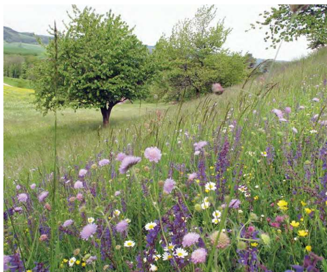
Extensive Wiesen in besonnten Lagen bieten eine reiche Blütenvielfalt.