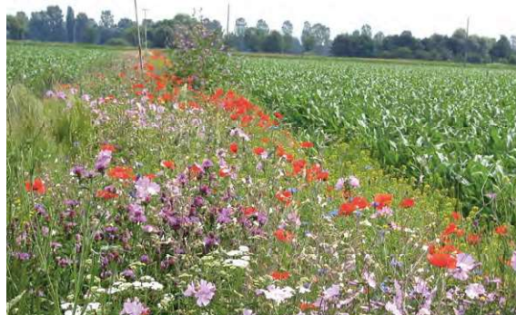
Blühstreifen und Buntbrachen können Wildbienenlebensräume im Ackerland miteinander verbinden.