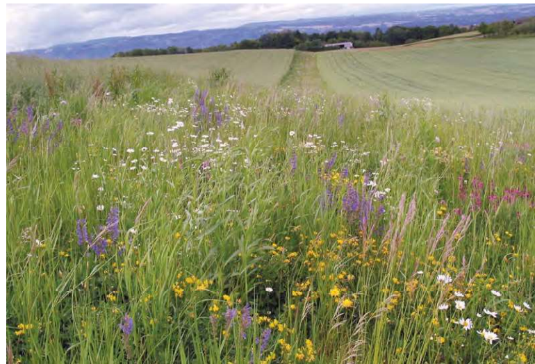
Bestehende, artenreiche Ackerkrautsäume oder angesäte Wiesenblumenstreifen bringen Blütenvielfalt in das sonst vielerorts blütenarme Ackerland.