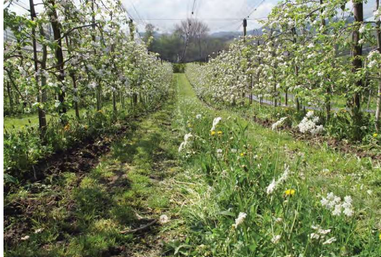
Mehrfährige, artenreiche Blühstreifen aus einheimischen Arten in den Fahrgassen von Obstanlagen fördern Bestäuber und natürliche Feinde von Schädlingen.