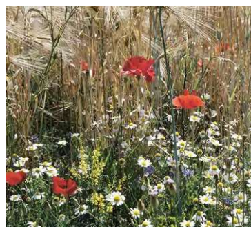
Viele Ackerwildkräuter wie Kamillen, Senfe, Kornblume und Mohn sind wertvolle Pollen- und Nektarquellen für Wildbienen.