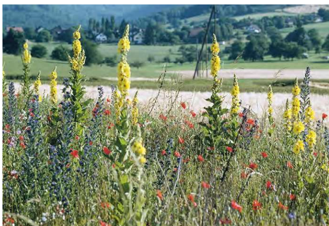
Blühstreifen und Buntbrachen fördern Bestäuber und Nützlinge in Ackerkulturen.