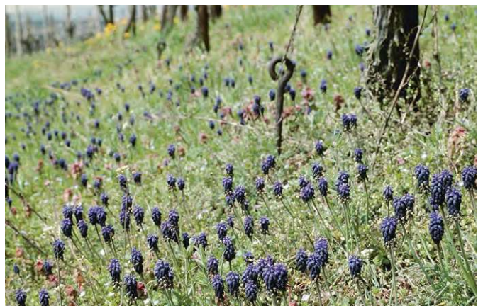
Bei spontaner Begrünung können sich bei lückiger Vegetation in den Fahrgassen und unter den Rebstöcken einjährige Arten und Frühlingzwiebelpflanzen wie die Traubenhyazinthe entwickeln.