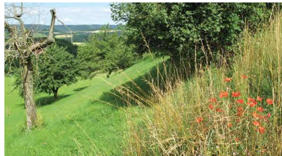
Totholzstrukturen und ein Blütenangebot in der Nähe ermöglichen vielen wenig mobilen Insektenarten ein Überleben.