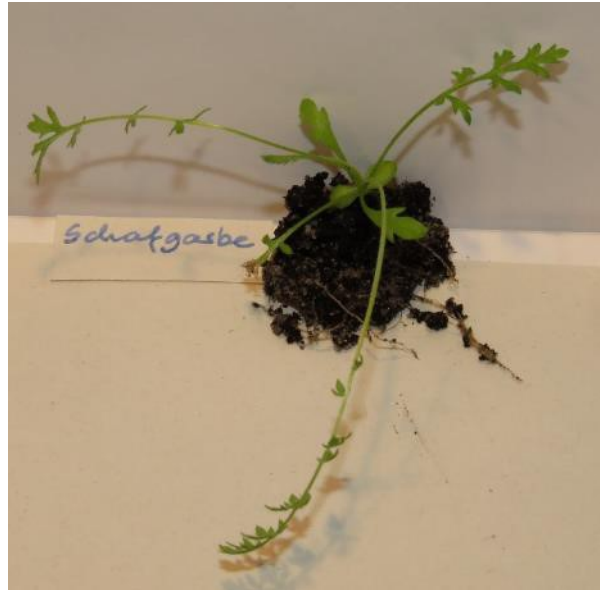
Schafgarbe (BS; ZS)