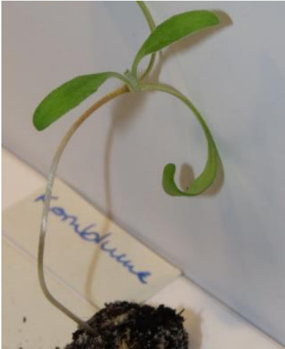
Kornblume (BS, ZS)