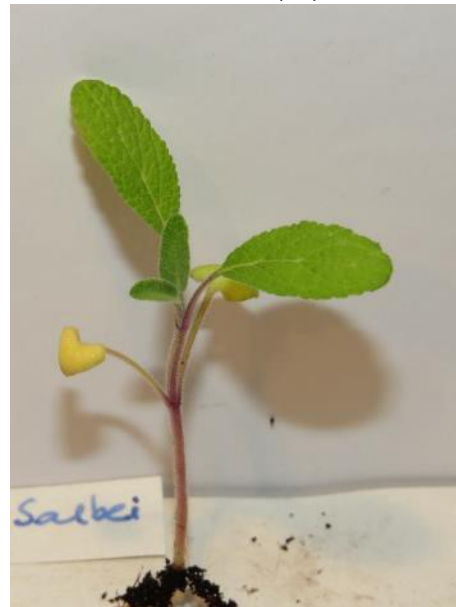
Echter Salbei (ZS)