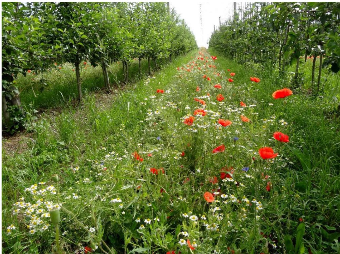
Blühaspekte im ersten Jahr bei Herbstsaat