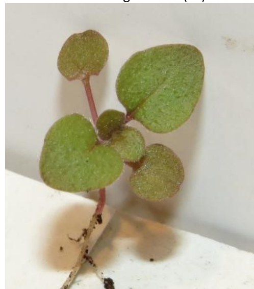
Gewöhnlicher Dost (ZS)