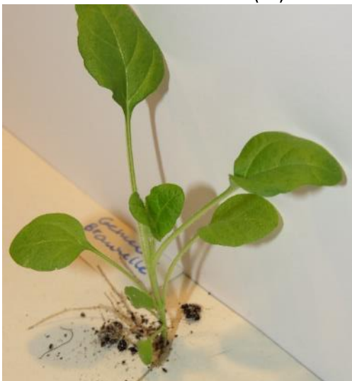
Gemeine Braunelle (BS)