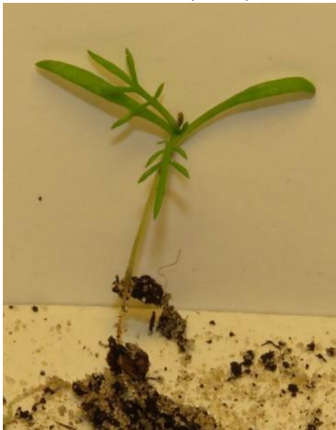
Echte Kamille (BS, ZS)