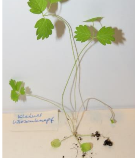
Kleiner Wieseckopf (BS)