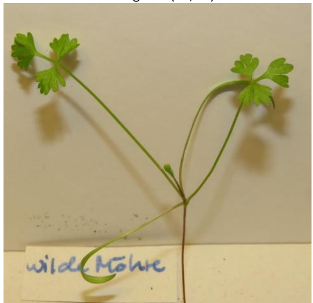
Wilde Möhre (BS)