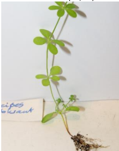
Weißes Labkraut (BS)