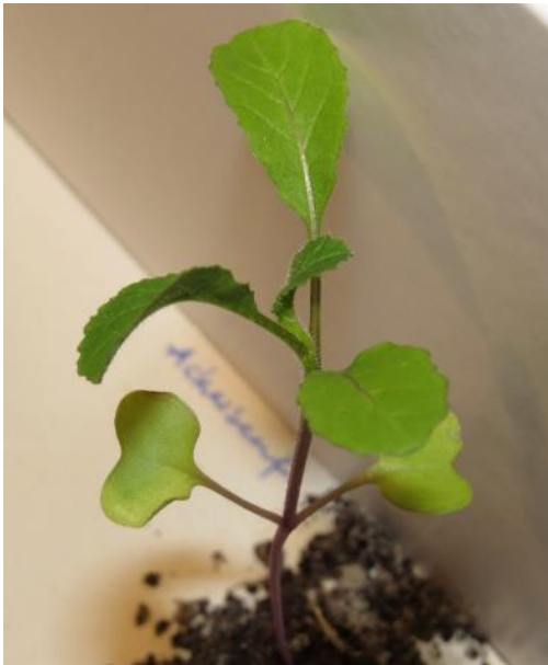
Acker-Senf (BS, ZS)