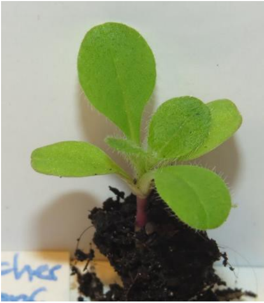
Gewöhnlicher Natternkopf (ZS)